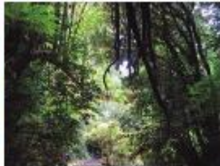
▲ Bosque valdiviano, sur de Chile.