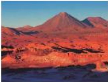
▲ Desierto de Atacama, norte de Chile.